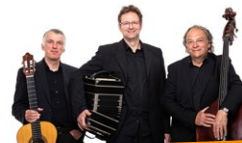
trio tipico westfalica

Für Jugendliche ab 7 Jahren / Familien, Eltern, Großeltern, Tanten, Onkels, Nichten, Neffen... Eintritt frei, Spenden erbeten